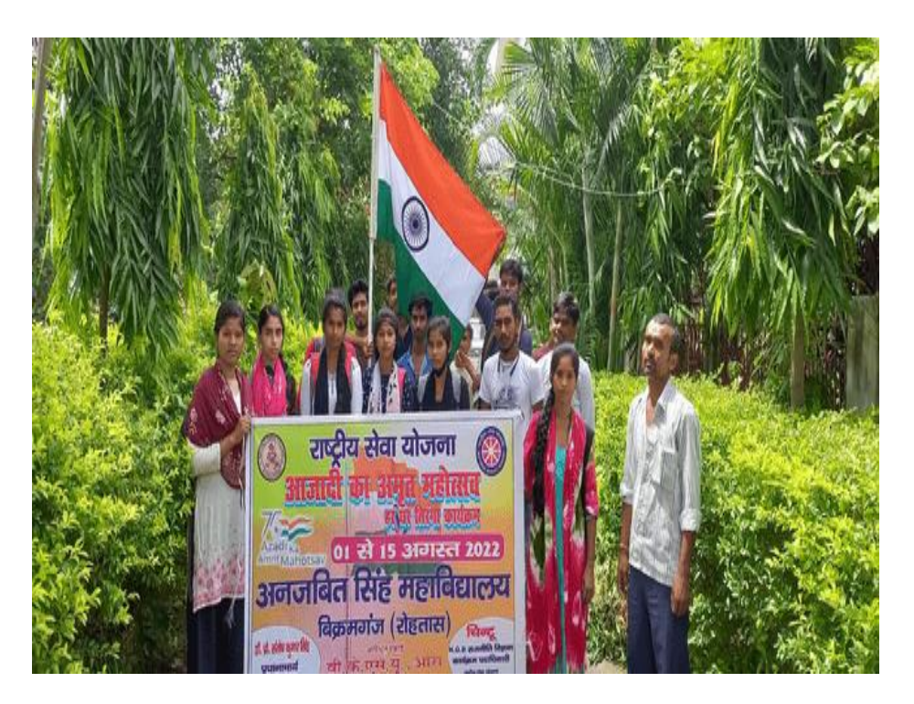
Glimpses of Rally which was organized by NSS Volunteers