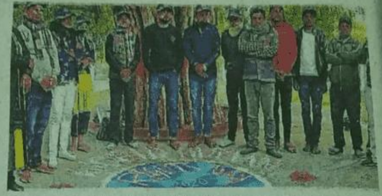
एएस कालेज परिसर में कार्यत्रम में उपस्थित शिक्षक, कर्मी व स्वयंसेवक।