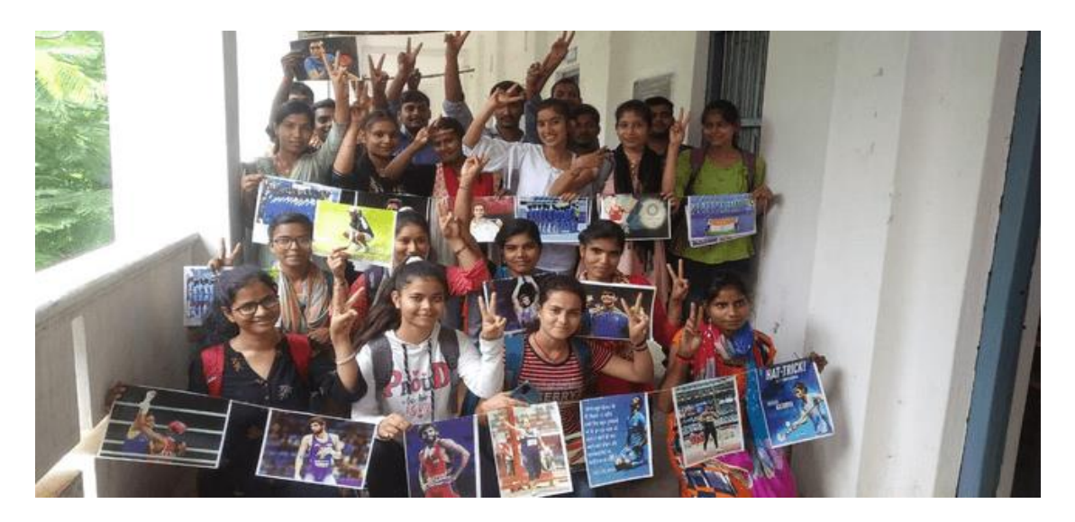
Volunteers cheering and celebrating the sportsmanship in college