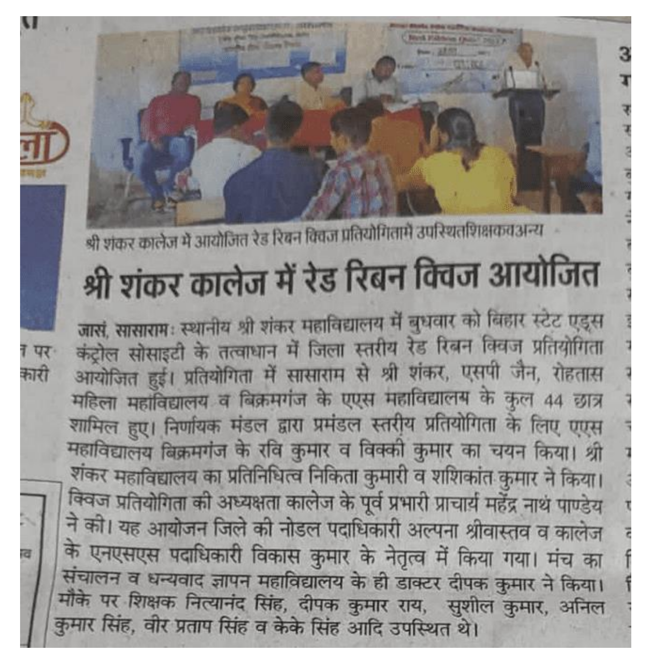
Figure 1 red ribbon club competition held at Sasaram